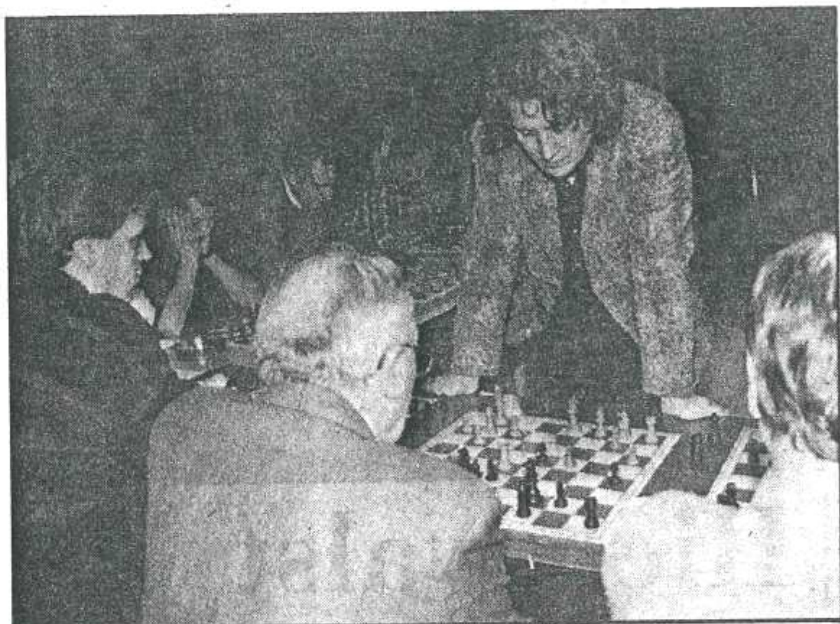
● Jan Timman schaakte in Roermond voor het goede doel.